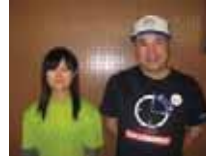
お手伝いの先生方